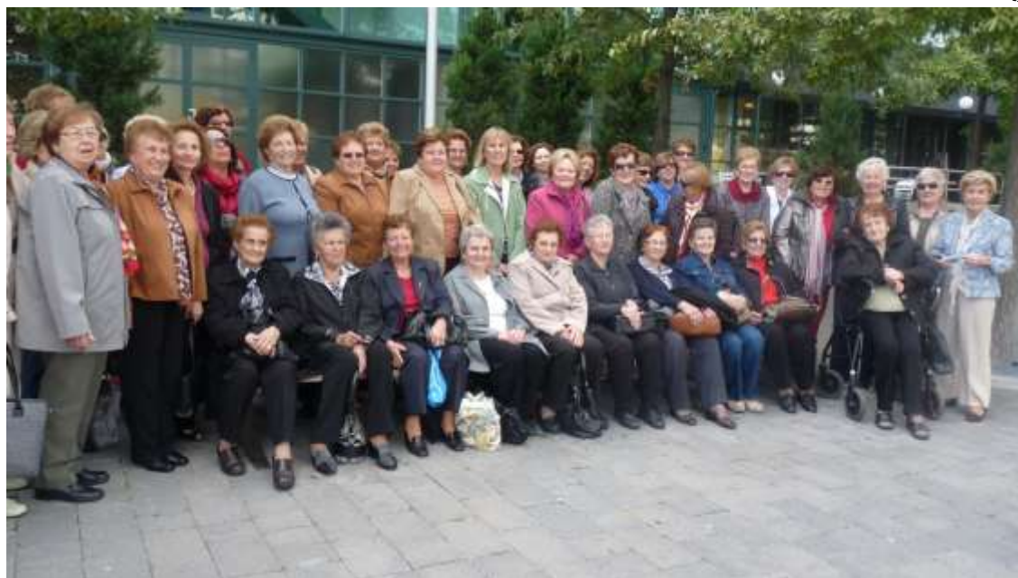
In un raro momento di tranquillità, quasi tutte le Donne insieme