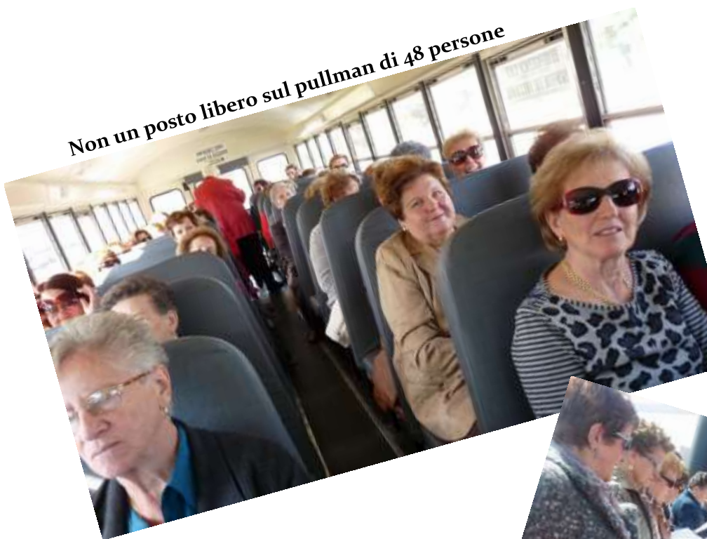
Non un posto libero sul pullman di 48 persone